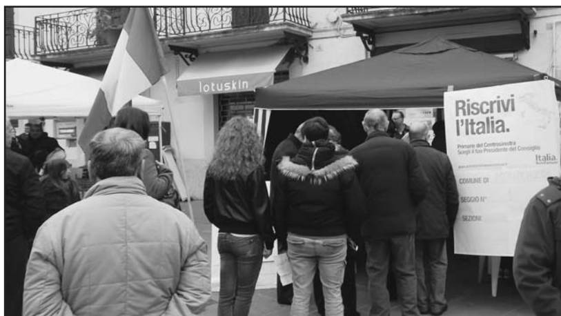
Code al seggio delle primarie.

Per il ballottaggio di domenica 2 dicembre si affronteranno BERSANI 44,9% e RENZI 33,5% a livello nazionale. Si può votare dalle ore 8 alle ore 20 presso il seggio in Piazza S. Maria.