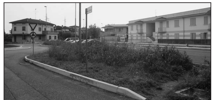
La nuova via di fuga dei pedoni.