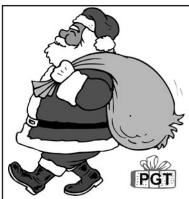
Babbo Natale e il PGT.

La consegna di queste norme è che chiunque proprietario di area non pianificata potrà richie-