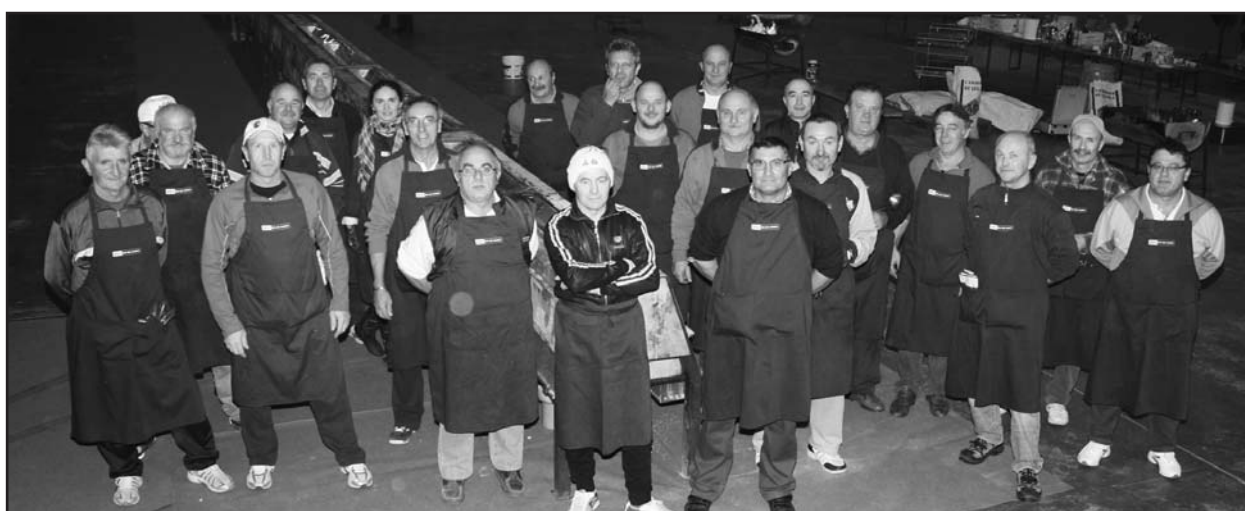
Il Gruppo Oratorio Borgosotto che anche quest'anno ha preparato lo spiedo legato ad un gesto natalizio nel donare un contributo al Presidente dell'Associazione "Un sorriso di speranza".