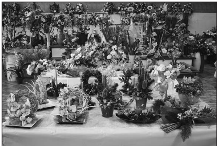
Composizioni floreali d'arredo e da regalo.