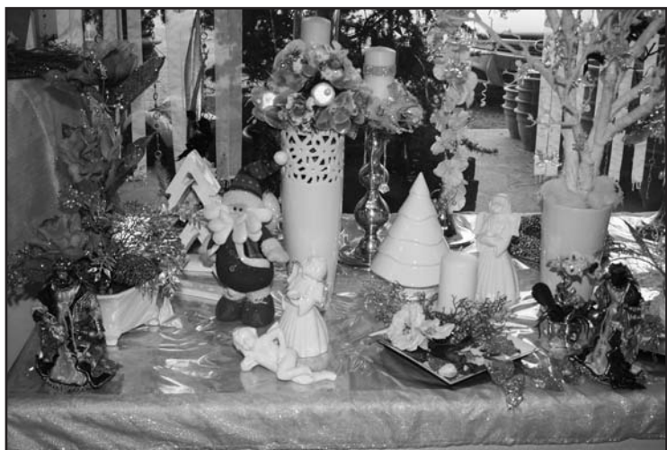
Oggettistica in tema natalizio.

Apertura SABATO 1 e DOMENICA 2 dicembre dalle ore 8 alle ore 12,30 e dalle ore 14,30 alle ore 19.