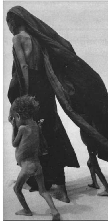
Drammi. In fuga dalla siccità.

ni di bambini che muoiono come mosche e patiscono ingiustizie in ogni angolo del mondo, perché? La domanda di sempre, forse retorica e vana, si pone di forza: perché il male? Quello degli eventi naturali incontrollabili e quello provocato dall'uomo per cattività, insipienza o indifferenza.