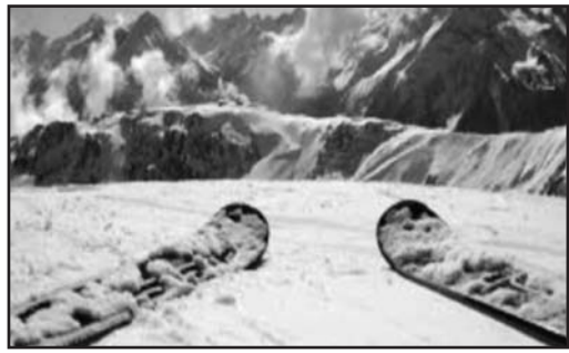
Sciare in alta montagna.

Vi ricordiamo che la F.I.S.I. offre una copertura assicurativa annuale sui rischi durante l'attività sciistica quali infortuni e spese di primo intervento. Per quanto concerne i corsi, essi si svolgeranno sui Campi Scuola di Folgaria (Tn) in collaborazione con i maestri della Scuola Italiana Sci. Le lezioni, comprendenti gruppi di 7/8 persone saranno ripartite su 4 domeniche per un totale di 8 ore (13 Gen-